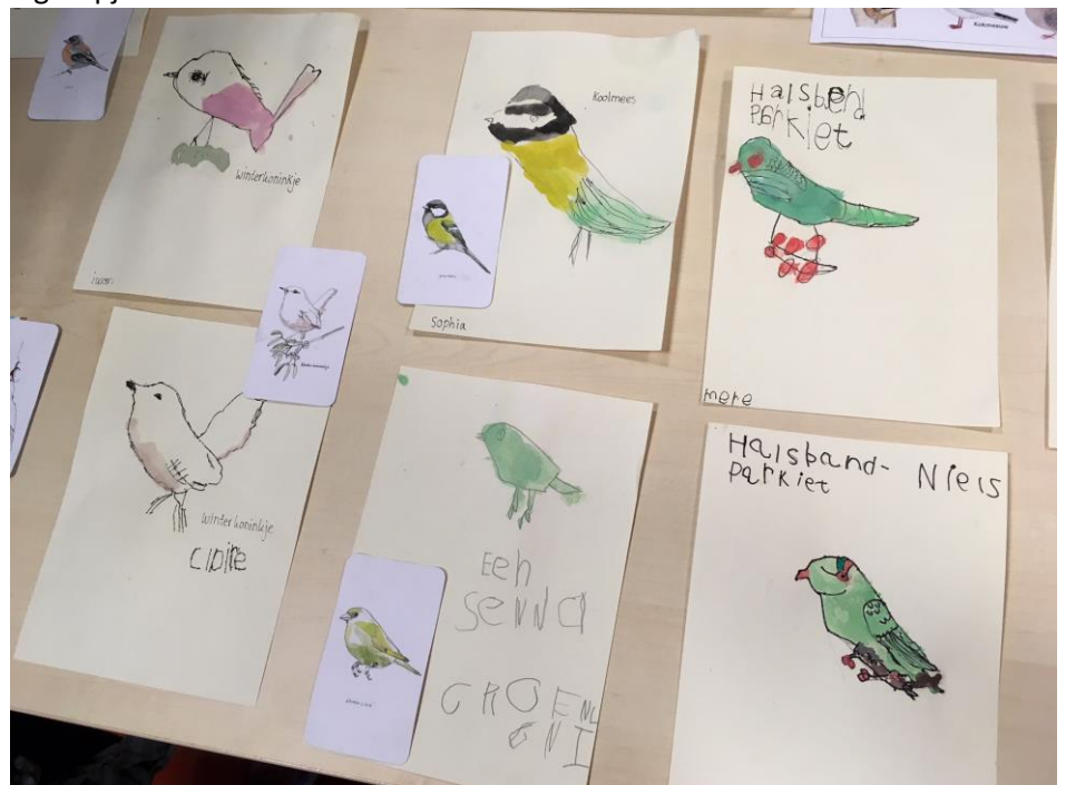
Een van de thema's bij de kleuters is vogels: welke vogels zie je in de stad?

De Universiteit van Amsterdam biedt zestig ouders de mogelijkheid om gratis deel te nemen aan de oudercursus "Praten met Kinderen". In de cursus wordt besproken hoe ouders om kunnen gaan met dagelijkse problematiek bij het opvoeden. De cursus is voor ouders met kinderen in de leeftijd van 10 tot 15 jaar. Er zijn 4 groepen en deze starten in maart en mei. Doordat de cursus onderdeel is van wetenschappelijk onderzoek, is deelname gratis. Voor aanmelding en meer informatie kunt u kijken op www.cursuspratenmetkinderen.nl of mailen naar pratenmetkinderen2018@gmail.com