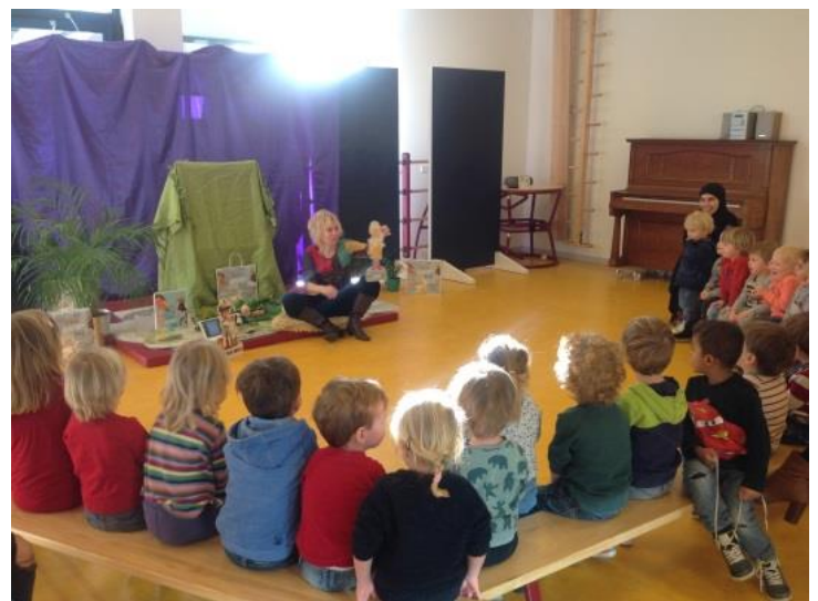
Voorstelling: 'We hebben er een geitje bij'

In school zijn de kinderen druk bezig de meest prachtige gedichten te schrijven, en elke dag zijn er wel ouders die gedichten komen voordragen in de klas. De week wordt afgesloten met een open podium op vrijdag 5 februari, van 13.00 tot 14.00 uur. Alle ouders en grootouders van onze MKC-kinderen zijn van harte welkom!