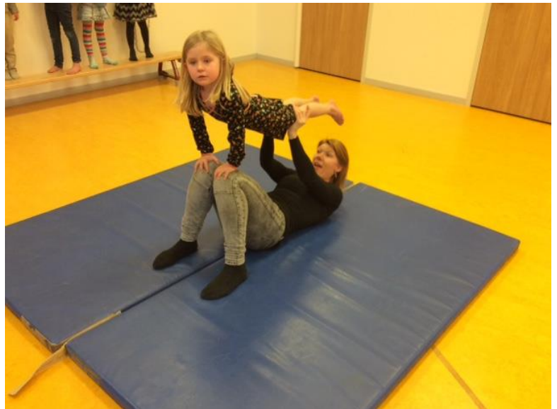
De kinderen hebben al veel geleerd over acrobatiek op de BSO, zoals dit spannende kunstje!

Wist u dat de sluitingsdagen voor 2016 ook alweer bekend zijn? Deze hangen op het kinderdagverblijf en bij de BSO in de gang en staan op de website.